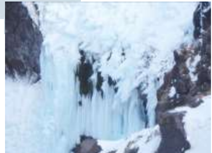
フレベの滝(イメージ)