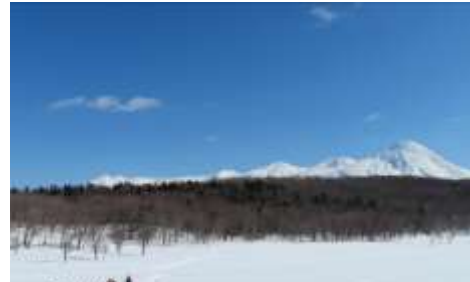
スノーシューハイキング(イメージ)